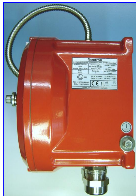
Abbildung: UV-Flammenmelder mit Automatischen UV - Test